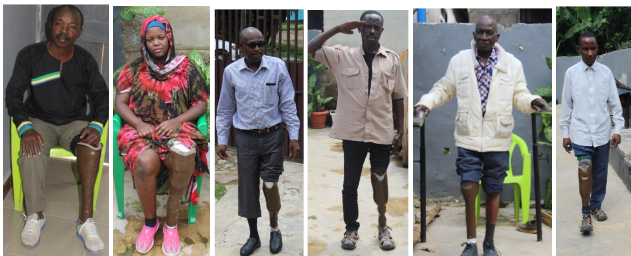
Alcuni dei beneficiari della campagna del 3 dicembre

L'ospite d'onore è stato il dottor Leopold Gilala, direttore dei servizi clinici degli ospedali AICT in Tanzania. Le protesi fabbricate nel corso di questa giornata saranno consegnate entro la fine di gennaio 2021.